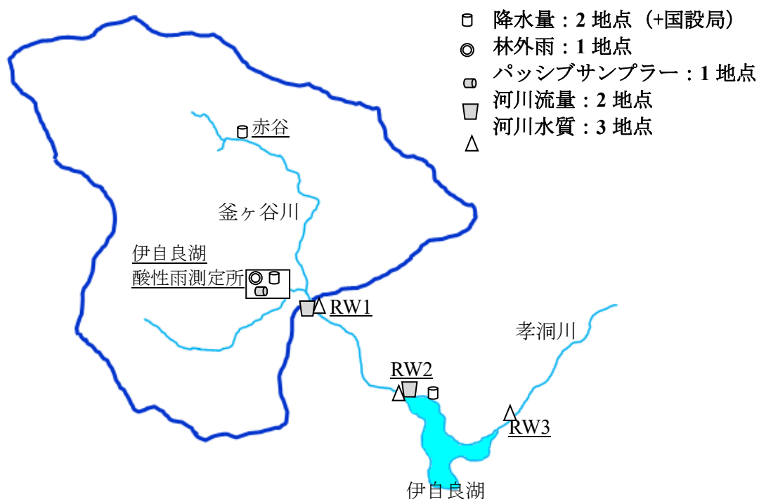
図1 令和4年度伊自良湖集水域モニタリング装置配置図